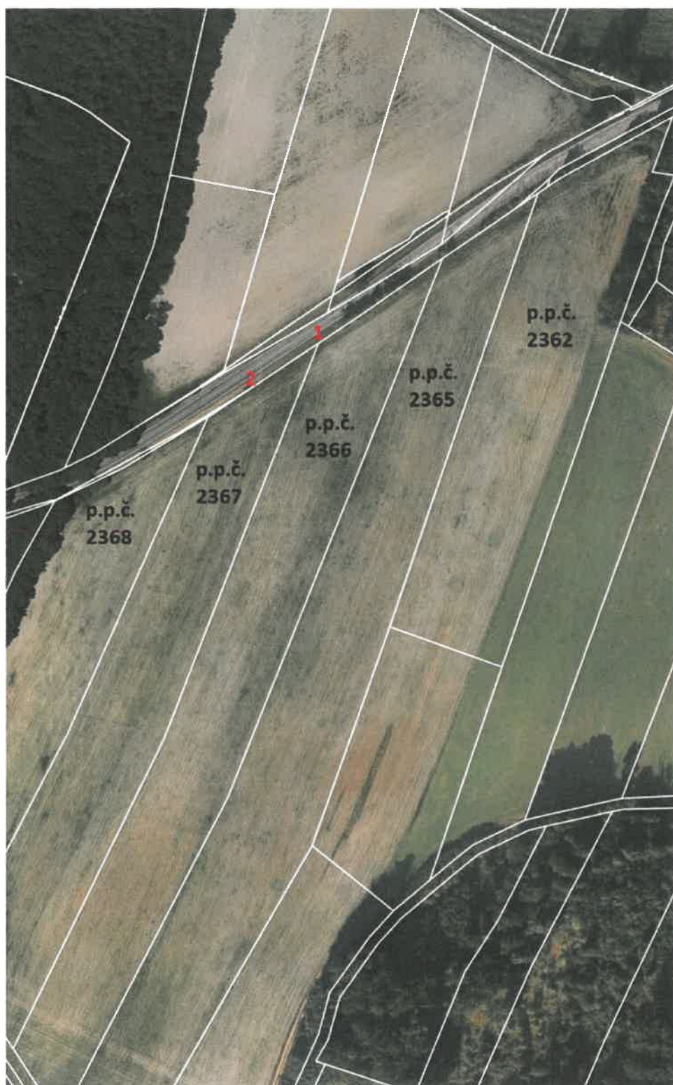
Obr. 3 – celkový pohled na půdní celek (poz. 1 – stávající sjezd, poz. 2 – plánovaný sjezd)