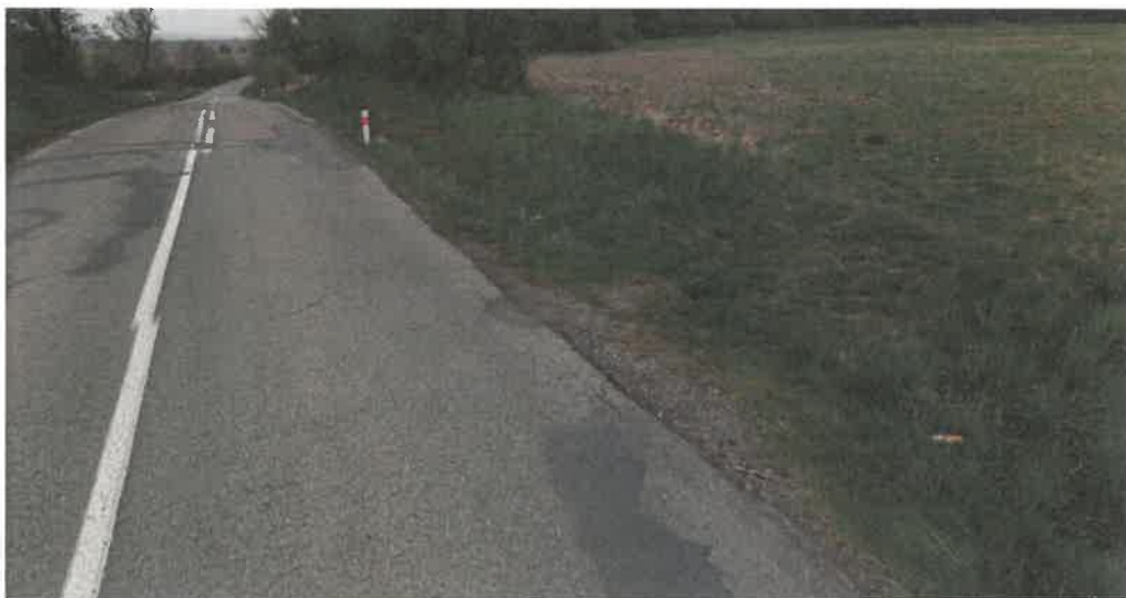
Obr. 2 – stávající sjezd na pozemek p.č. 2366 a p.č. 2367 (detailní pohled)

Odvolací orgán dále zjistil z Veřejného registru půdy – LPIS, že celý půdní celek je zemědělsky využíván společností AKRA, spol. s.r.o., IČO 42196159, se sídlem Štěnkov 90, 503 46 Třebechovice pod Orebem a Filipem Vodičkou, IČO 21284610, se sídlem Poděbradova 43, Pražské Předměstí, 500 02 Hradec Králové. Odvolací orgán opakovaně zdůrazňuje, že není zcela účelné, resp. ani možné (z důvodů BESIP - v praxi by to znamenalo sjezd na každou část pole ze silnice po cca 5 metrech...), aby ke každé části půdního celku, byť by jeho části byly jiných vlastníků, zřizovat samostatné jednotlivé sjezdy.