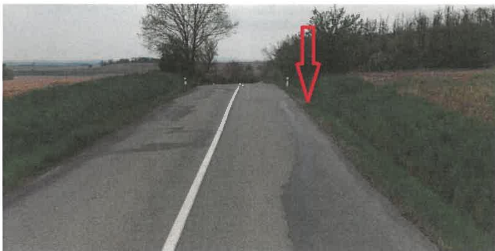
Obr. 1 – stávající sjezd na pozemek p.č. 2366 a p.č. 2367